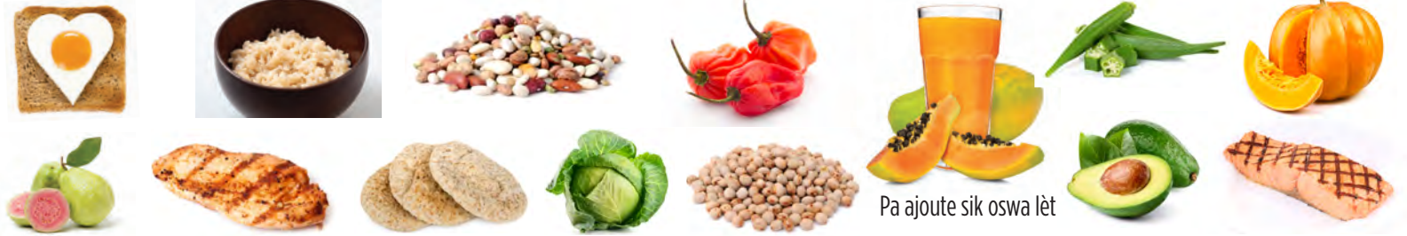
Pa ajoute sik oswa lèt

PI BON CHWA KOTIDYEN RICH AN NITRIMAN TRÈ SEN