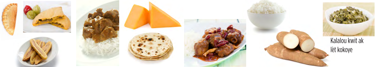
Kalalou kwit ak lèt kokoye

OK "PLIZYÈ FWA NAN YON SEMÈN GEN KÈK NITRIMAN SEN NAN MODERASYON