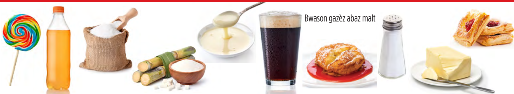
Bwason gazèz abaz malt

MANJE PA OKAZYON VID AN KALORI PA TWÒ SEN